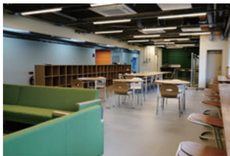
ライブラリー・休憩スペース