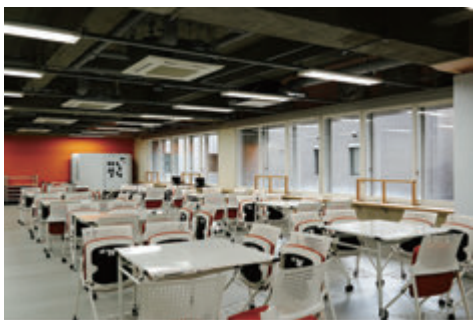
グループワークスペース